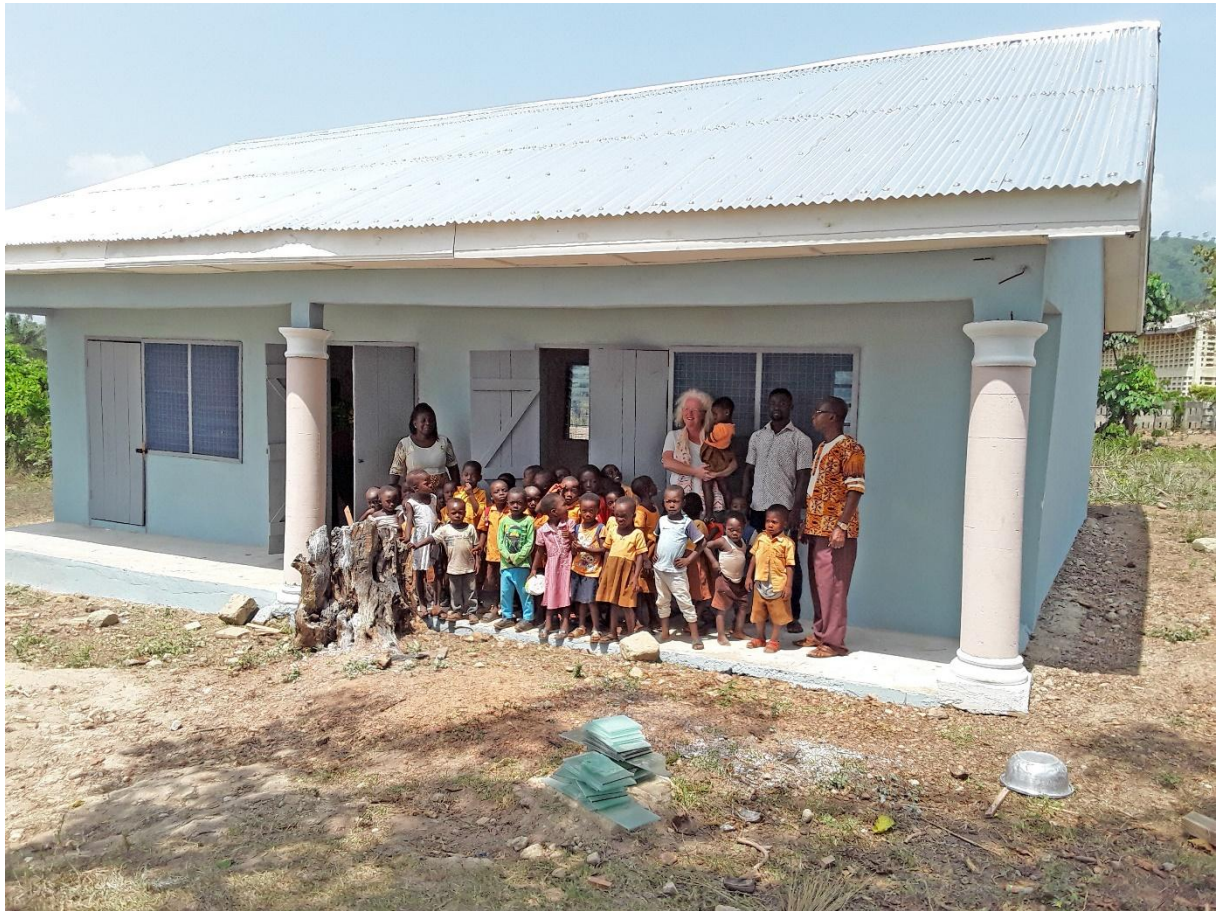
Project Kleuterschool Akaasu, bezocht door bestuurslid Els Bonten in 2018.