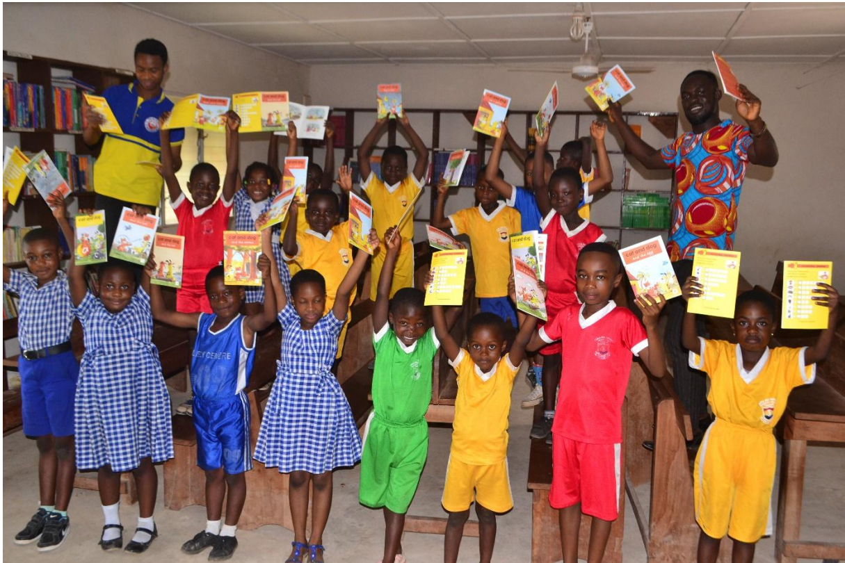
Project lezen, voor elk kind een leesboek, 2019