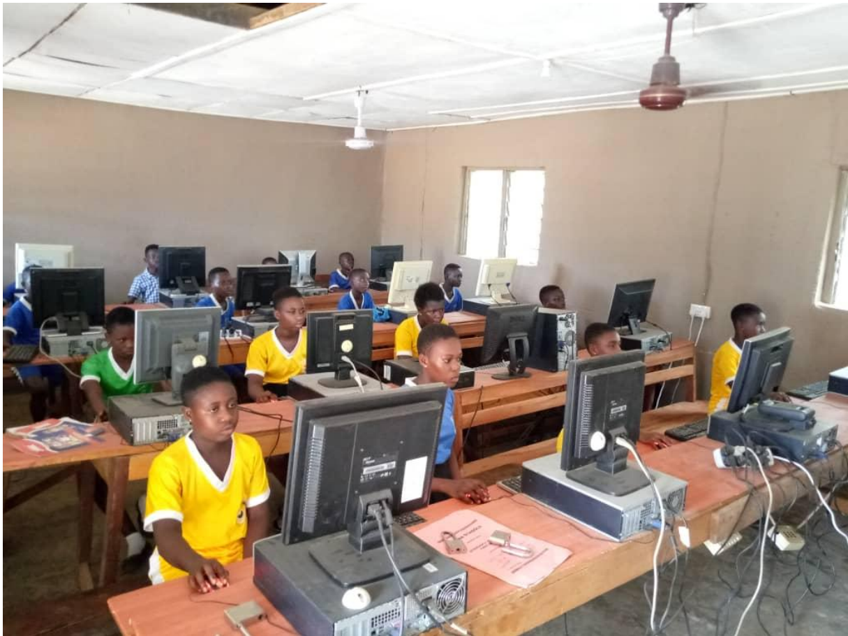
Project ICT klaslokaal met ca. 20 computers, opgeleverd 2020.

Op grond van de statuten van de stichting (bepaling omtrent besluitvorming door het bestuur) en haar feitelijke werkzaamheden heeft geen enkel (rechts)persoon doorslaggevende zeggenschap binnen de Stichting. Aldus kan geen enkel (rechts)persoon beschikken over het vermogen van de stichting als ware het eigen vermogen.